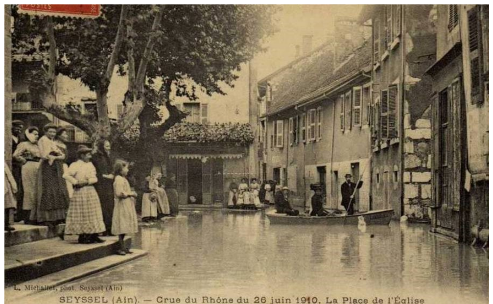
Seyssel (Ain)

Comme mentionné dans les écrits de A. Dufournet, les seysselanes et les seysselans utilisaient des barques comme moyen de locomotion pour se rendre au travail ou pour se rendre à l'épicerie.