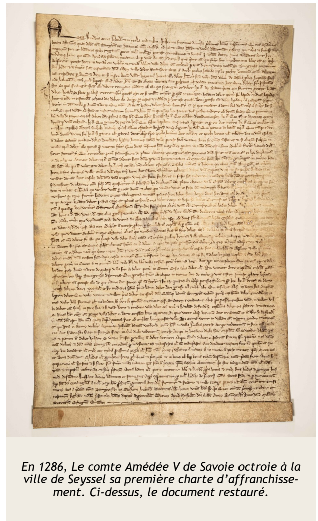
En 1286, Le comte Amédée V de Savoie octroie à la ville de Seyssel sa première charte d'affranchissement. Ci-dessus, le document restauré.

Une convention de partenariat, sous la conduite des Archives départementales de l'Ain, a été signée avec l'Institut National du Patrimoine, premier établissement national d'enseignement supérieur d'excellence qui forme les futurs restaurateurs du patrimoine, pour la restauration pédagogique de quatre parchemins. »