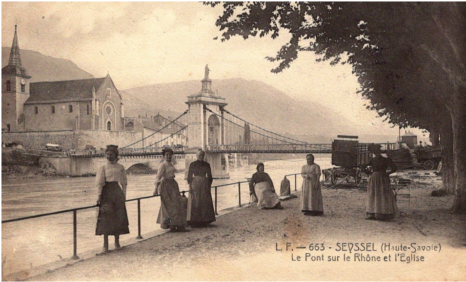
L. F. — 663 - SEYSSSEL (Haute-Savoie) Le Pont sur le Rhône et l'Église

Félix FENOUILLET – Histoire de la ville de Seyssel de son origine jusqu'à nos jours- 1891